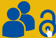
Servicestelle Open Access Bonn